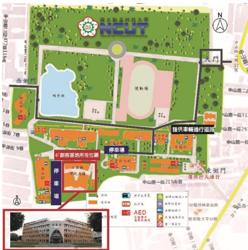
國立高雄科技大學（第一校區）